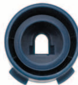
Vista posteriore dei bocchigli Rain Curtain