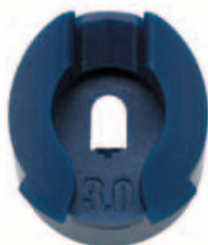
Vista frontale dei bocchigli Rain Curtain